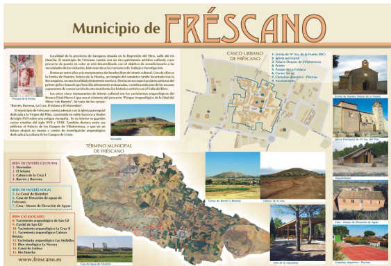
Cartel interpretativo del municipio de Fréscano rotulado por impresión digital con antigrafiti. 1200 x 840 mm.

Para proteger nuestro entorno cultura y natural es necesario darlo a conocer para poder apreciarlo todos, de esta manera se preserva y se fomenta el desarrollo de las zonas donde esté ubicado. Para esto no hay nada mejor que la señalización acorde al entorno.